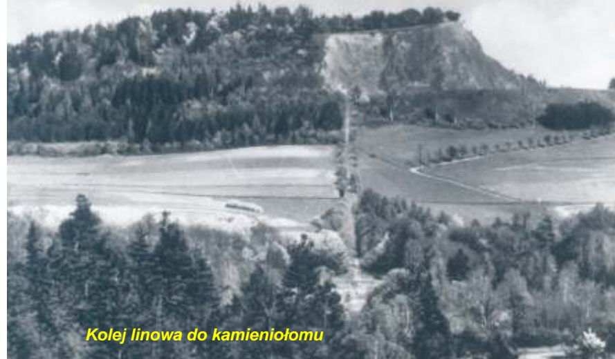
Kolej linowa do kamieniołomu

Góra na przestrzeni ostatniego półwiecza radykalnie zmieniła swój wygląd. Przyczynił się do tego usytuowany tam kamieniołom bazaltu. Poprzez powojenną i zarazem bardzo intensywną eksploatację kamienia bazaltowego odkryto skały w taki sposób, że pokazany został układ geologiczny zastępy w kraterze law wulkanicznej. Przekrój ten ilustruje wielokrotnie erupcję wulkanu w tym samym miejscu. O warto ci tego miejsca stanowi odkrycie bazaltów, które w okresie miocenu wylały się z góry ponad 20-30 km. Stęgnące bazalt spisał w kształcie wielobocznych słupów, wygiętych łukowo, o oryginalnym wachlarzowym rozchyleniu, które geolodzy nazywali „róznicami bazaltów” lub