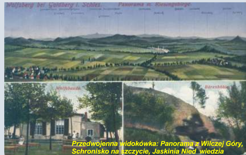
Przedwojenna widokówka: Panorama z Wilczej Góry, Schronisko na szczycie, Jaskinia Niedźwiedzia

zarówno przez niemiecką młodzież, jak i ich wychowawców oraz osoby im towarzyszące z ogromnym zainteresowaniem i zrozumieniem. Nie było tutaj wliczanych wielu innych znaczących przedsięwzięć podejmowanych i realizowanych w przeszłości i mających ten sam cel. Muszę jednak wspomnieć, co było bezpodstawnym powodem podjęcia dzisiaj na łamach naszego czasopisma dyskusji na temat Wilczej Góry. W roku 2006, pod koniec minionej kadencji Rady Gminy Złotoryja, na wspólnym nadzwyczajnym posiedzeniu wszystkich komisji miało miejsce wystąpienie ludzi spoza Złotoryi, którzy przedstawili się jako naukowcy, podjęli się przekonania radnych o znikomej, by nie rzec adnej - warto ci tej osławionej, widocznej z daleka skały zwanej „Wilkołakiem”. Według nich to, co widzimy na skałę, to „adna różnica” dopiero, gdy usunie się wierzchołek góry, naszym oczom ukazała się