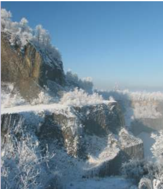
eksploatacja bazaltu. Stan laby Pani na czele takiego fanclubu?

Obecnie roboty górnicze prowadzi się w kierunku przeciwnym niż Rezerwat Półki i Filarski kontrolowane i mierzone przez Urząd Górnicy,